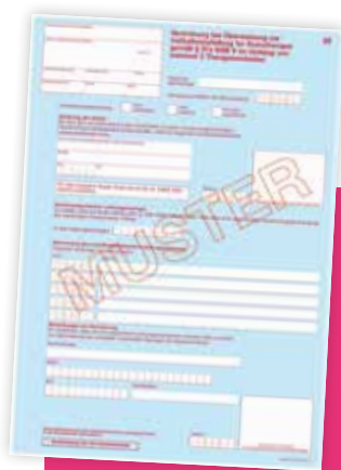
Formular 28 zur Verordnung bei Über- weisung zur Indikations- stellung für Soziotherapie

Ärzte und Psychotherapeuten benötigen für die Verordnung von Soziotherapie eine Genehmigung der Kassenärztlichen Vereinigung (KV). Dafür stellen sie bei ihrer KV einen „Antrag auf Abrechnungsgenehmigung zur Verordnung von Soziotherapie“. Darauf müssen sie unter anderem Einrichtungen angeben, mit denen sie kooperieren (gemeindepsychiatrischer Verbund oder vergleichbare Versorgungsstrukturen). Erst wenn die Genehmigung der KV vorliegt, darf Soziotherapie verordnet und zulasten der gesetzlichen Krankenversicherung abgerechnet werden.